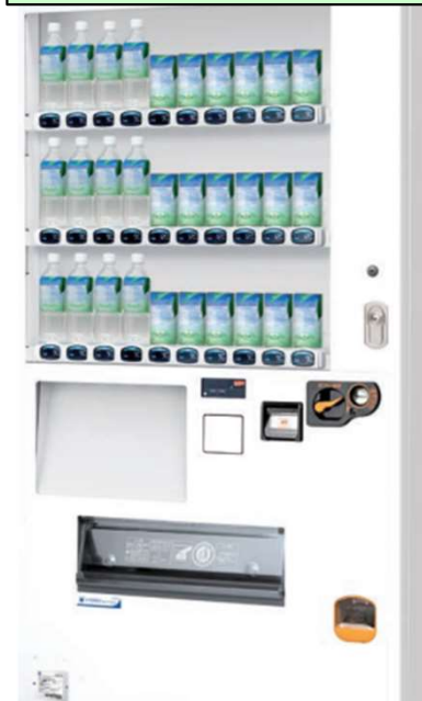
缶・ペットボトル F30WP6C 30セレクション30押ボタン