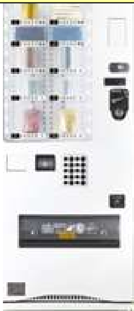
小型汎用自動販売機 FRM10D5CZ2NM マルチ君 (ペアコラム対応)