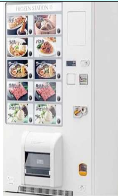
冷凍自動販売機 FS107WFXU2 (FROZEN STATION II)