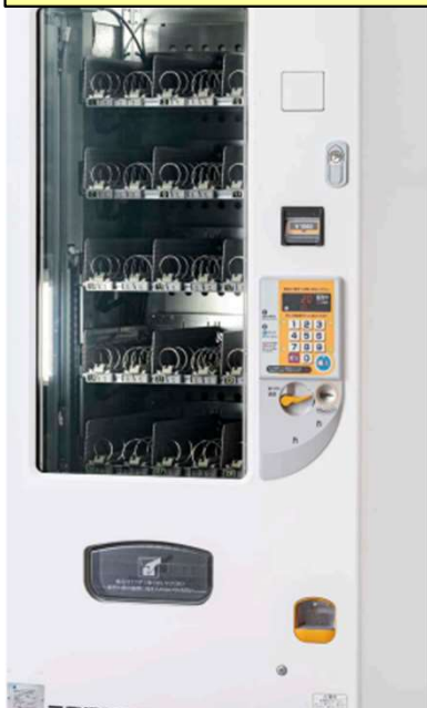
中型汎用自動販売機 FNS130シリーズ 136シリーズもあり